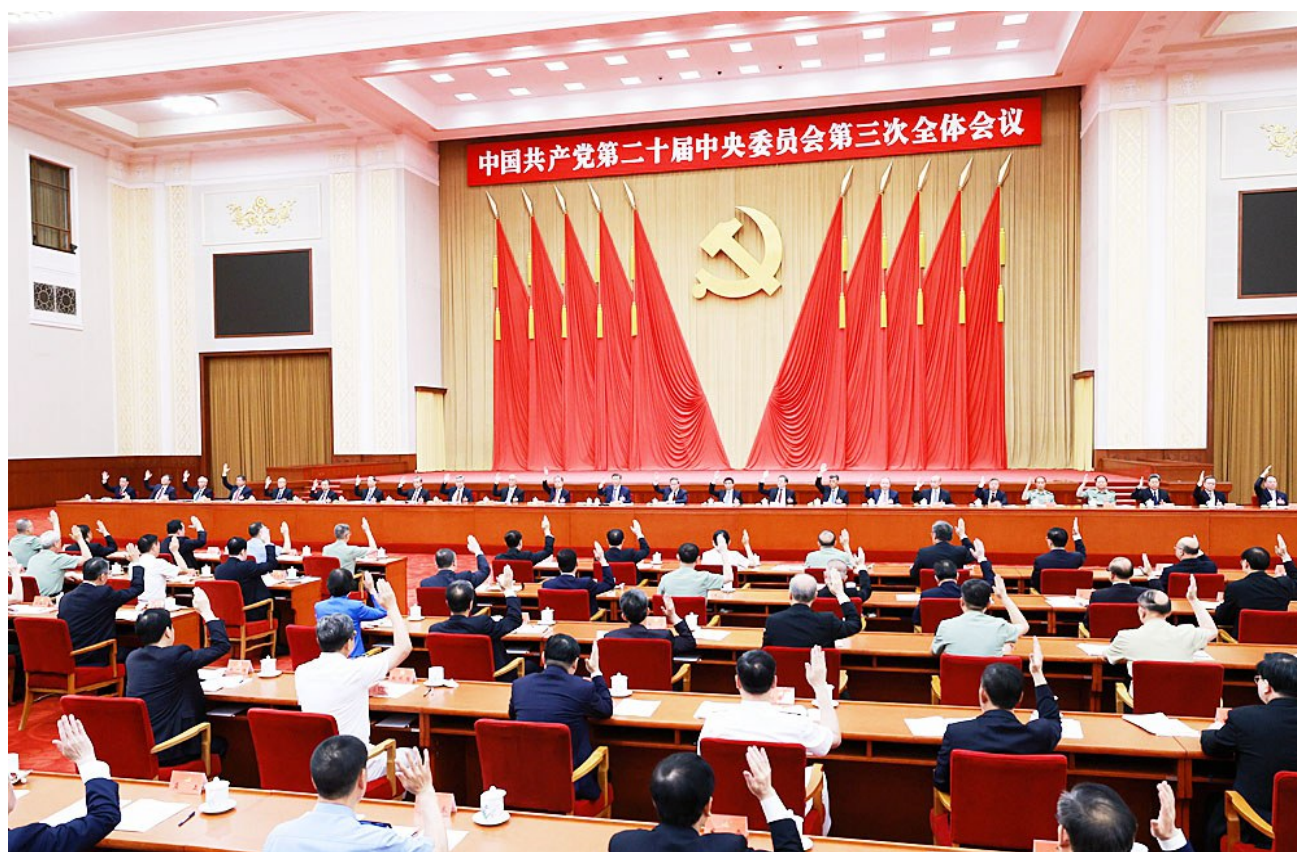
中国共产党第二十届中央委员会第三次全体会议,于2024年7月15日至18日在北京举行。中央政治局主持会议。新华社记者 王晔