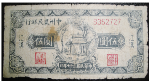
中州农民银行伍圆券

在中国历次革命战争中,为巩固革命政权,稳定金融秩序,助力苏区(解放区)经济发展,由中国共产党领导的各地革命政权都建立了自己的银行或信用合作社等金融机构,在不断探索金融支持革命战争和创立、巩固新政权的同时,亦担负起发行货币、支持根据地或解放区经济发展的任务,为全国解放后开创社会主义金融事业积累了宝贵的经验。从1926年10月的大革命时期,到1949年3月全国解放前夕,仅包括湖北在内的中原地区就相继建立了黄冈信用合作社、鄂豫皖苏维埃银行、鄂西农民银行、鄂北农民银行、鄂东南工农银行、豫鄂边区建设银行等多家金融机构,发行的货币有各种面值的纸币、铜币、银元和临时股票等,有力地支持了各级革命政权的金融建设。在这些内容丰富的货币中,由中州农民银行发行的纸币中州银行币,在中国共产党百年历程的红色金融建设中,虽然属于较晚的一种,但对于中原地区解放战争的顺利推进发挥了重要作用。