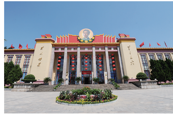
安源路矿工人运动纪念馆